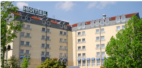
Konsul Hotel Hotelstraße 1, 06184 Kabelsketal