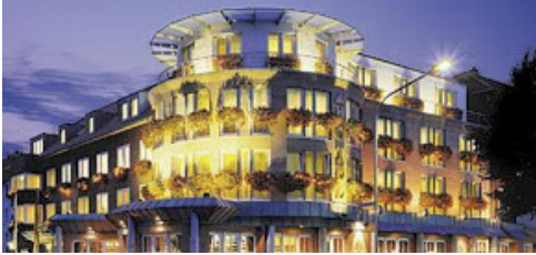
Hotel am Stadtring Stadtring 33, 48527 Nordhorn