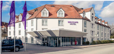
Mercure Hotel München Freising Airport Dr.-von-Daller-Str. 1-3, 85356 Freising