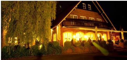
Waldhaus an de Miälkwellen Grevener Str. 43, 49549 Ladbergen